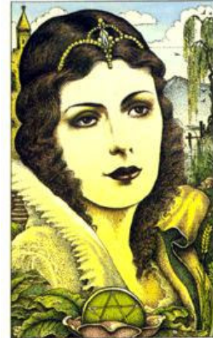
QUEEN OF PENTACLES

Casa de Conselho: Utilizar a segurança pessoal como base, manter tudo como está, evitar movimentos precipitados ou atitudes, preservar as coisas como estão para que a estabilidade traga melhor estrutura.