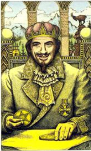
KING OF PENTACLES

Representação: Concretização, domínio patriarcal, realização pelo poder possuído.