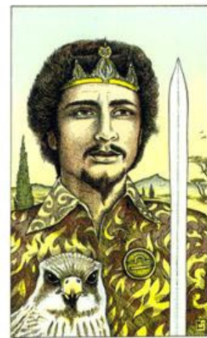
KING OF SWORDS

Casa de Conselho: Lutar pela vitória e conquista do que se quer, não dispersar quanto ao seu intento tampouco abrir mão de seus planos ou realizações.