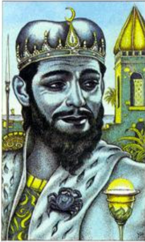
KING OF CUPS

Representação: Domínio da vaidade e desejos pessoais, realização do que é melhor para si, conquista pessoal e egóica.