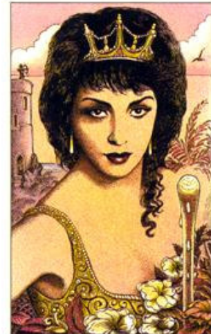
QUEEN OF WANDS

Casa de Conselho: Ser mais prestativo, mais participativo, menos interesseiro ou egoísta, usar mais das relações positivamente e valorizar a troca, o bem estar geral (não apenas pessoal).