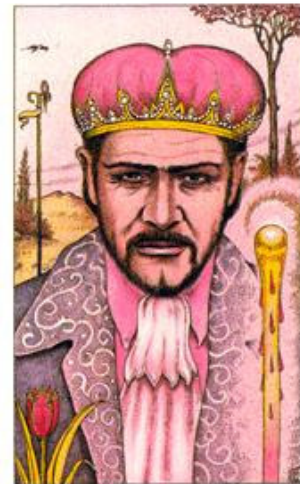
KING OF WANDS

Casa de Conselho: Estar mais consciente e aberto a conquistas para saber crescer e obter estrutura, sem perder o que já foi alcançado e poder compartilhar sem medo de perder.