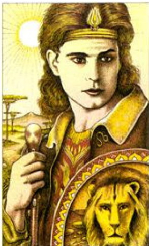
PRINCE OF WANDS

Representação: Arrojo, ousadia, sagacidade, coragem e luta por realização usando de inteligência e criatividade.