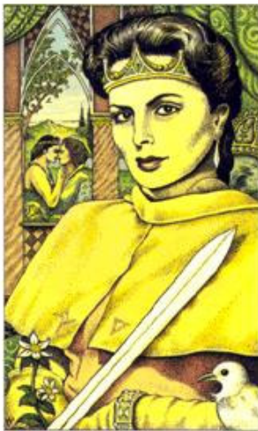
QUEEN OF SWORDS

Representação: Vingança, ressentimento, necessidade de revidar o que julga ser mal, crueldade, frieza, ausência de perdão.