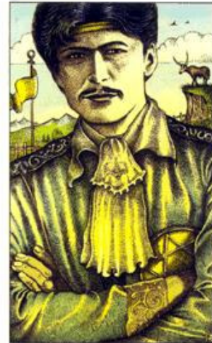
PRINCE OF PENTACLES

Casa de Conselho: Assumir uma postura mais determinada para conseguir o que deseja, estar mais firme e seguro de sua busca, assumir o intento de posse, ir ao encontro do que se dispôs a conseguir sem desânimo ou ceder as dificuldades.