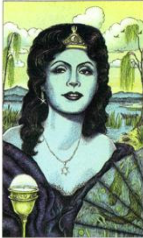
QUEEN OF CUPS

Representação: Segredo, mistério, dissimulação, esconderijo, oculto.