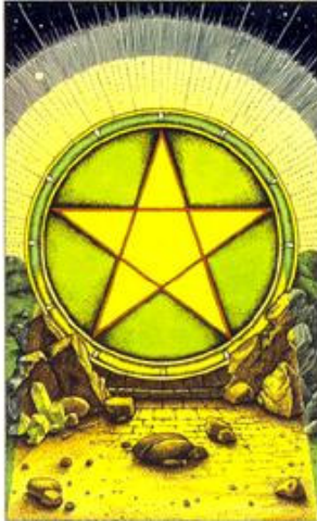
ACE OF PENTACLES

Representação: Realização material, concretização sólida e materialização do tema em questão.