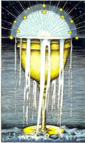
ACE OF CUPS