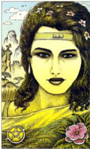
PRINCESS OF PENTACLES

Representação: Especulação, investigação sem garantia de retorno, movimentação prática e investigativa.