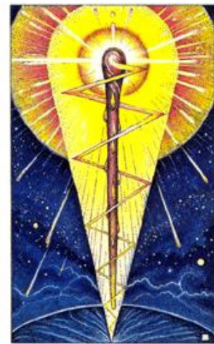
ACE OF WANDS

Casa de Conselho: Expandir com consciência, apostar no equilíbrio e maturidade, se disponibilizar a novas conquistas férteis, visualizar e se disponibilizar a novas colheitas.