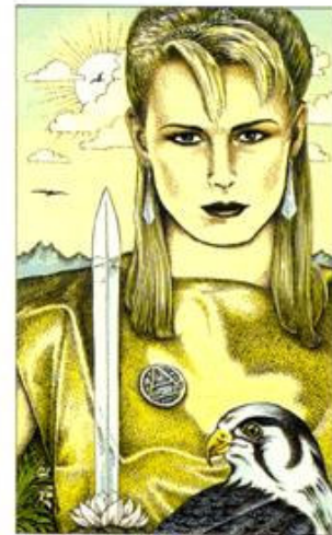
PRINCESS OF SWORDS

Casa de Conselho: Usar mais astúcia e inteligência para lidar com as situações, abusar do jogo de cintura e sagacidade para obter resultados, ser mais dissimulado(a) em relação ao que foi questionado .