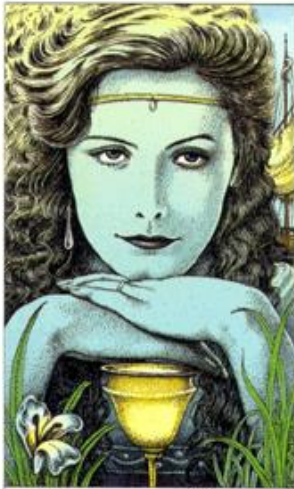
PRINCESS OF CUPS

Representação: Construtividade, boas promessas, intenções positivas, investimento com intenção de crescimento e obtenção futura de recompensas.